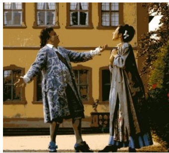
Der Handwerker als Edelmann (J. A. Hasse) Filmproduktion für das Bayerische Fernsehen im Schloß und Rokokogarten Veitshöchheim

1994 Würzburg, Residenz: Der Handwerker als Edelmann