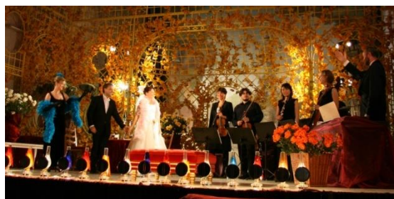
Wien bleibt Wien (Highlights aus der Wiener Operette) in der Orangerie der Würzburger Residenz

2004 Bad Bramstedt (Schleswig-Hollstein) Hotel Meridien: Wien bleibt Wien