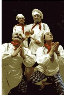
Zwerg Nase (Chr. Kabitz): Die Köche

1994 Helsinki (Finnland), Nationaloper, feierliche Einweihung des neuen Opernhouses: Pimpinone