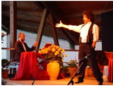
Zauber der Operette , das Beste aus der Welt des Dreivierteltaktes