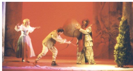
Acis und Galathea , stilgetreue Kostüme und Bühnenbild