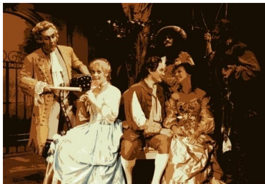
Der Zauberbaum (Chr. W. Gluck) in der Bearbeitung von Dr. Blagoy Apostolov

1987 Baden-Baden, Goethe Theater: Der Zauberbaum