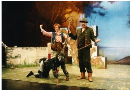
Petja und der Wolf von Sergej Prokofieff

1992 Ansbach, Prunksaal Residenz: Pimpinone