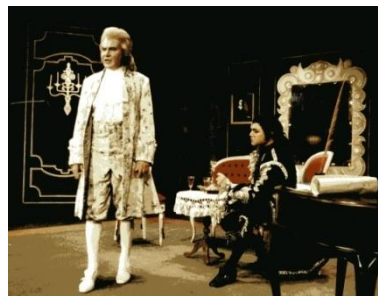
Mozart und Salieri (N. A. Rimsky-Korsakow) in der Originalfassung am Klavier

1991 Fladungen (BY) Grenzlandhalle: Mozart und Salieri