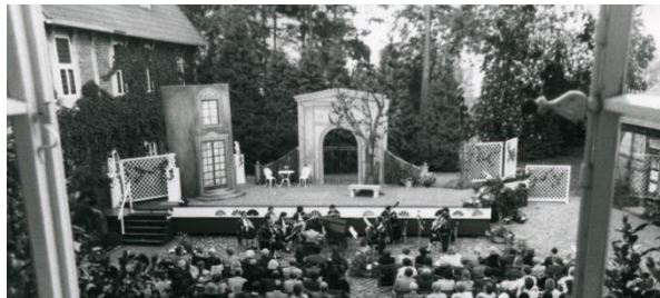
Der Zauberbaum von Gluck als Freilicht-Version in Bleckede und Reinbeck