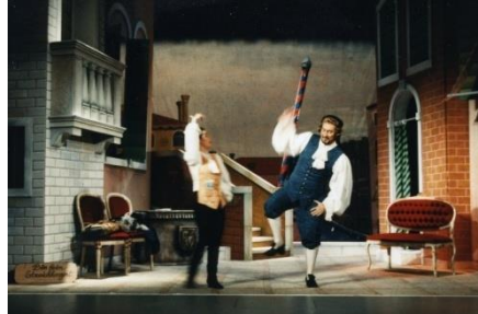
Der Handwerker als Edelmann , eine echte Venezianische Idylle