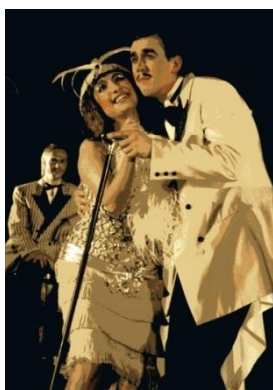
Du bist mein Augenster Musicalrevue mit den berühmtesten Schlägern der 20er und 30er Jahre