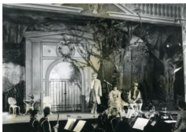
Der Zauberbaum von Chr. W. Gluck, eine Ausgrabung der Bayerischen Kammeroper mit neuem Text des Intendanten und Regisseurs Dr. Blagoy Apostolov

1987 Veitshöhheim: Der Zauberbaum (Chr. W. Gluck). Verfilmung durch das Bayerische Fernsehen.