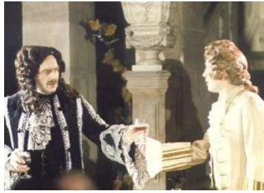
Mozart und Salieri (Rimsky-Korsakow) im Veitshöchheimer Schloß

1991 Veitshöchheim, Schloß: Mozart und Salieri (N. A. Rimsky-Korsakow)