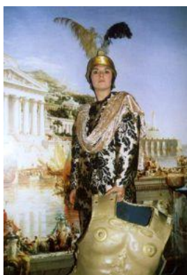
Dido und Aeneas (Aeneas)

2003 Bengel (NW) Karmeliterkloster: Dido und Aeneas