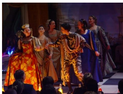
Dido und Aeneas von Henry Purcell