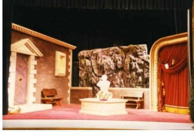
Der Verhöhnnte Eifersüchtige von G. B. Pergolesi

1989 Hanau, Comoedienhaus Wilhelmsbad: Der verhöhnte Eifersüchtige