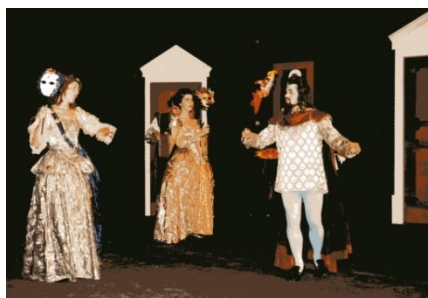
Signor Monteverdis Geburtstagsparty Collage auf Werken von Claudio Monteverdi