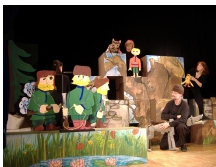
Petja und der Wolf in der Bühnenfassung mit gespielten Puppen