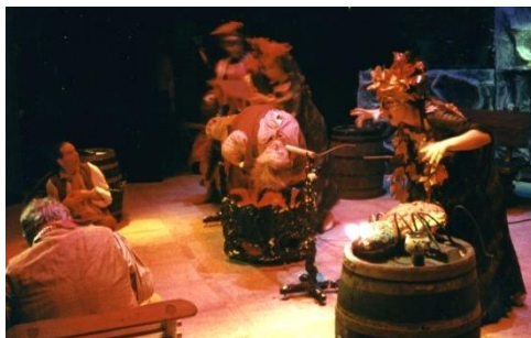
Der bekehrte Trunkenbold (Gluck): Die Teufelsszene