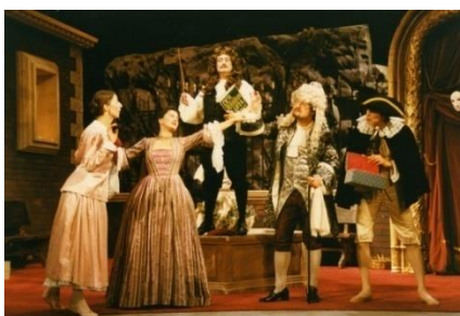
Pergolesis Parodie Der Verhöhnnte Eifersüchtige als Koproduktion mit dem Théâtre Royal de Wallonie, Lüttich

1986 Lüttich (Belgien), Opéra de Wallonie : Der Verhöhnnte Eifersüchtige ( Il geloso schernito ) (G. B. Pergolesi)