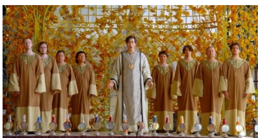
Die Zauberflöte in der kammermusikalischen Fassung, wie Mozart sie ursprünglich konzipiert hatte