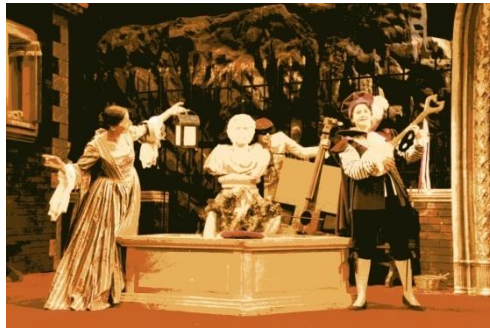
Der verhöhnte Eifersüchtige (Pergolesi) in der Opéra Royal de Wallonie (Lüttich)