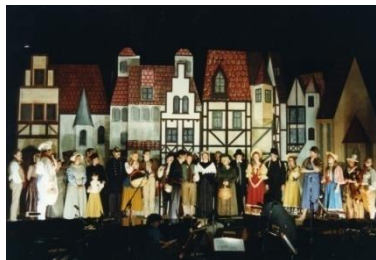
Aus dem vertonten Märchen Zwerg-Nase von Wilhelm Hauff erstrahlt ein Stückchen fränkisches Flair