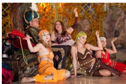
Wer will aus so einem Serail entführt werden...???