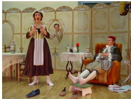
Die Kaffee-Kantate wie im Zimmermannschen Kaffeehaus zu Bachs Zeiten