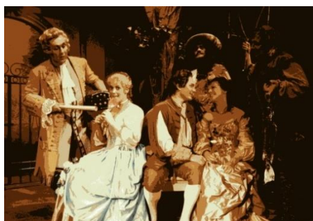
Der Zauberbaum (Gluck): Totale unter dem Zauberbaum

1991 Aschaffenburg, Stadttheater: Zwerg Nase